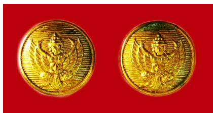
กระดุมครุฑ จะเหมือนกันทุกกระทรวง ทำด้วยโลหะโปร่งสีทอง เป็นรูปครุฑสีทอง