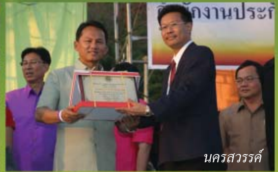
นครสวรรค์