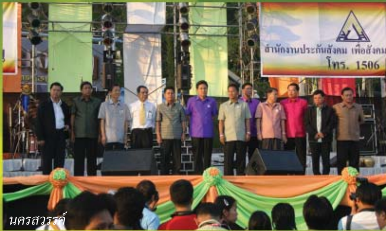
นครสวรรค์