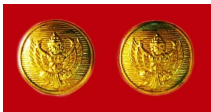
กระดุมครุฑ จะเหมือนกันทุกกระทรวง ทำด้วยโลหะโปร่งสีทอง เป็นรูปครุฑสีทอง