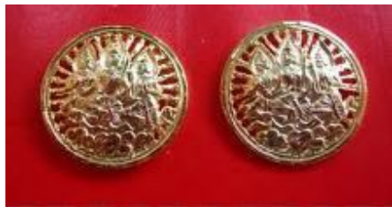
เครื่องหมายแสดงสังกัด จะมีความแตกต่างกันในแต่ละกระทรวงในส่วนของกระทรวงแรงงาน จะมีลักษณะทำด้วยโลหะโปร่งสีทอง เป็นรูปเทวดา 3 องค์ (ห้ามเคลือบพลาสติก) ติดบริเวณคอเสื้อทั้งสองข้างติดกลางปกเสื้อ