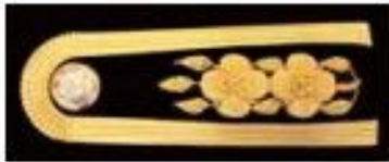
เครื่องหมายอินทนู ลักษณะเป็นช่อชัยพฤกษ์ มีดอก 2 ดอก