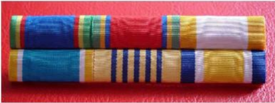
แพรแถบเครื่องราชฯ ทำด้วยผ้าแพรแถบ ไม่มีพลาสติกหุ้มติดที่หน้าอกเหนือกระเป๋าด้านซ้าย ประมาณ 0.5 เซนติเมตร