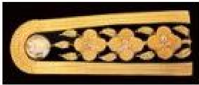
เครื่องหมายอินทนู ลักษณะเป็นช่อชัยพฤกษ์ มีดอก 3 ดอก