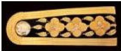
เครื่องหมายอินทนู ลักษณะเป็นช่อชัยพฤกษ์ มีดอก 3 ดอก