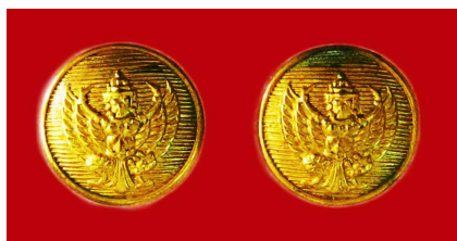
กระดุมครุฑ จะเหมือนกันทุกกระทรวง ทำด้วยโลหะโปร่งสีทอง เป็นรูปครุฑสีทอง