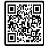
QR CODE แผ่นพับหน้าที่ 2