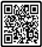
QR CODE แบบฟอร์ม