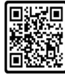
QR CODE แผ่นพับหน้าที่ 1