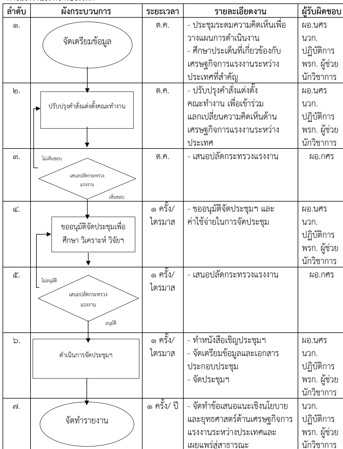
รูปที่ ๒ ผังการไหลเวียนของกระบวนการเสนอข้อเสนอแนะเชิงนโยบาย และเชิงยุทธศาสตร์ด้านแรงงานที่เกี่ยวข้องกับเศรษฐกิจการแรงงานระหว่างประเทศ

กระบวนการหลัก: การเสนอข้อเสนอแนะเชิงนโยบายและเชิงยุทธศาสตร์ที่เกี่ยวข้องกับเศรษฐกิจ การแรงงานระหว่างประเทศ